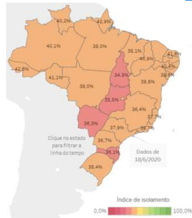
Figura 1 – Índice de isolamento social no dia 19/06. Fonte: Inloco .

No Brasil, o número de casos confirmados cresceu 18% e o de óbitos 14,5% em uma semana. Na data desta publicação o país atingiu a marca de 1 milhão de casos confirmados e 48 mil óbitos em decorrência da doença 2 . O Brasil é o segundo país em número de casos e agora também o segundo em número de mortes acumuladas. Apesar da curva nacional de casos e óbitos ainda estar na ascendente, a fadiga por conta da duração da quarentena e o relaxamento das medidas de restrição em muitas cidades continuam mantendo o índice de isolamento social em tendência de queda, atingindo os menores patamares desde o início das medidas restritivas (fonte: Inloco ).